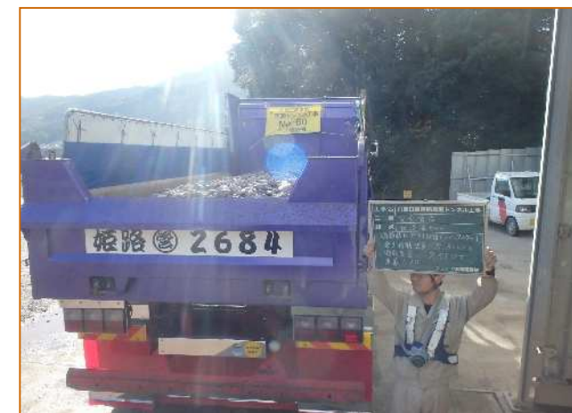
簡易重量測定(過積載防止対策)

現場HP http://www.geocities.jp/penta_cb/maze/01_home.html 五洋HP http://www.penta-ocean.co.jp