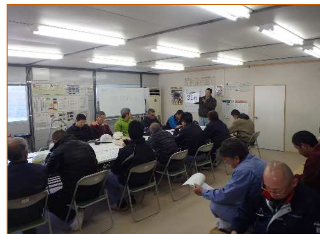
安全教育・訓練 現場ホームページも開設しておりますのでぜひご覧ください。