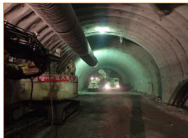
トンネル掘削状況