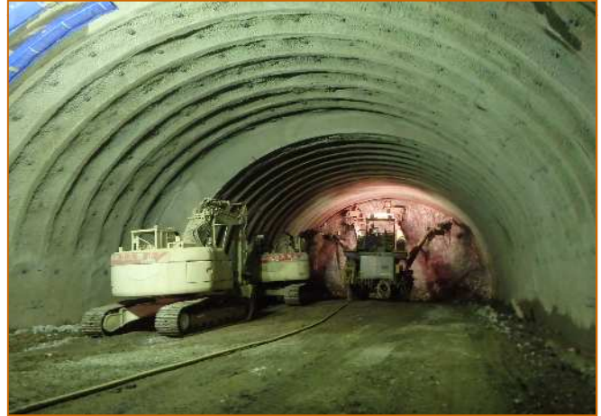
トンネル掘削状況