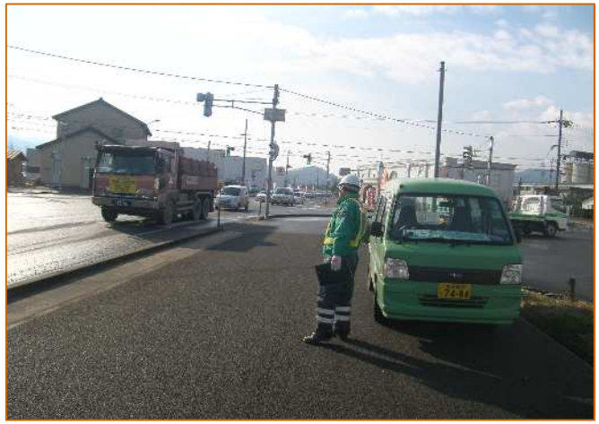
安全運行監視状況