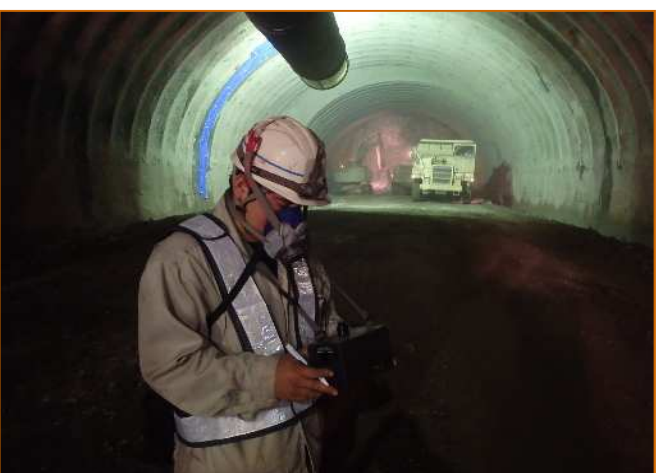
坑内環境測定状況