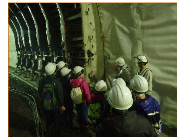
現場見学会 高柳小学校のみなさん