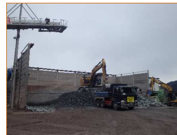
土砂積み込み状況