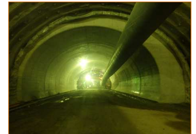
覆工完了区間（非常駐車帯入口）