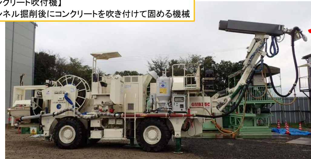
【コンクリート吹付機】 トンネル掘削後にコンクリートを吹き付けて固める機械