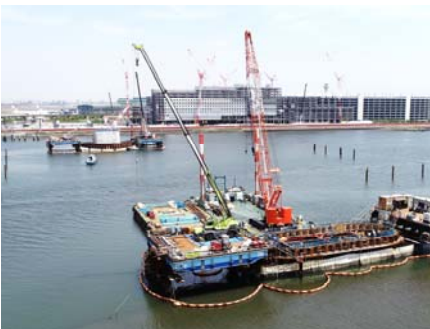
P3・P4橋脚全景 (川崎側から羽田空港側を望む)

昨年2月から工事を進めていたP4橋脚が4月末に完成し、河川の水を締切っていた鋼管矢板を切断し、多摩川に橋脚の姿が現れました。また、殿町側のP3橋脚は、柱の半分程度まで施工が進み、8月頃には完成する予定で、いよいよ橋桁の架設が本格的に始まります。