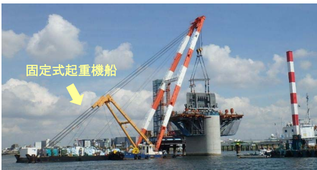
P4橋脚柱頭部架設状況

富津市では、P3-P4橋脚間の橋桁の組立が最盛期を迎えており、所狭しと架設時期を待っています。今後、P3橋脚上へのブロック4個の架設を行ったのちに、P3-P4橋脚間の台船架設を行います。