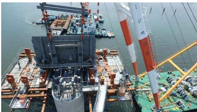
P4橋脚柱頭部架設状況