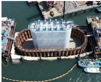
P4橋脚全景(鋼管矢板切断前)