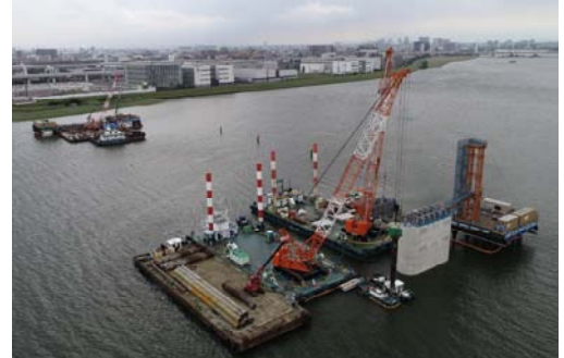
P4橋脚全景(鋼管矢板切断後)