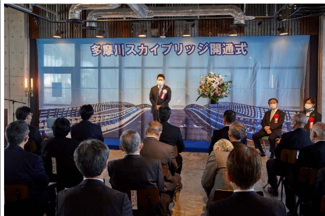
開通式（川崎キングスカイフロント東急REIホテル）