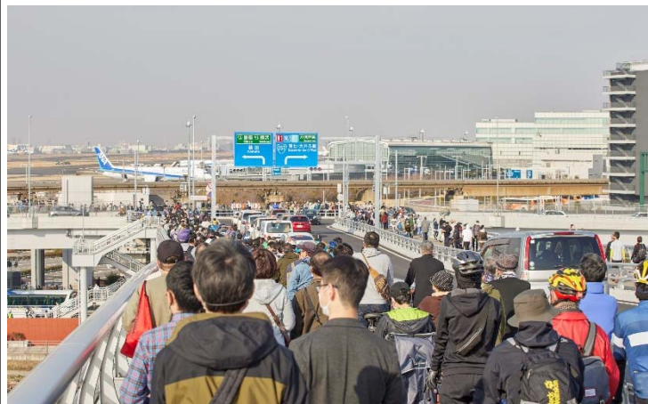
多くの人で賑わう開通直後の多摩川スカイブリッジ