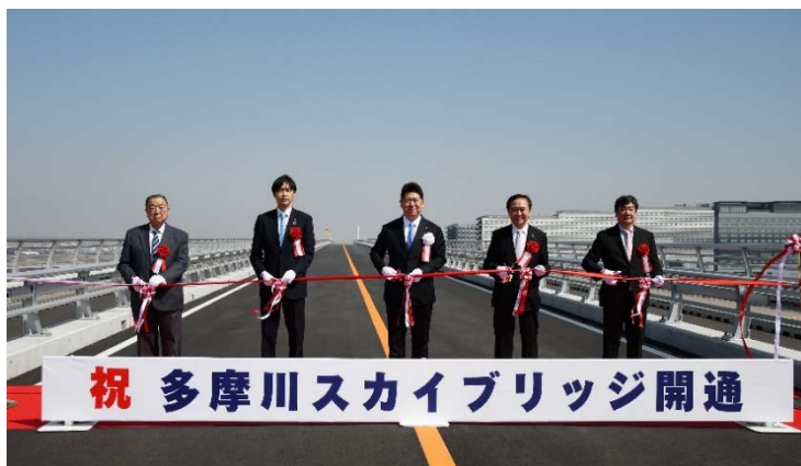
テープカット（多摩川スカイブリッジ橋上）