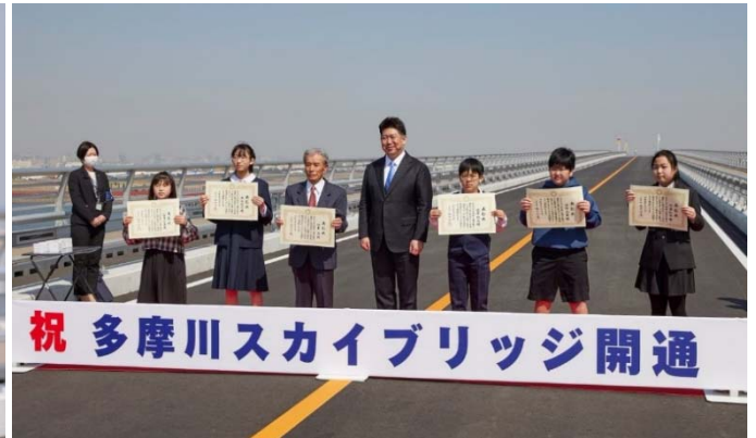
招待者の集合写真