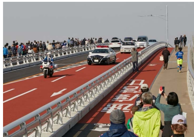
警察車両の先導により開通